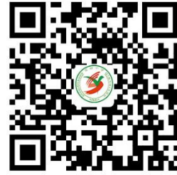
学校服务事项清单