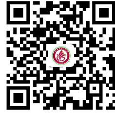
学校服务事项清单