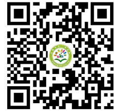
学校服务事项清单