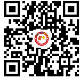
违规禁办事项清单