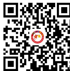
学校服务事项清单