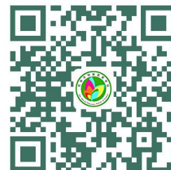
学校服务事项清单