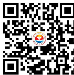
容缺办理事项清单