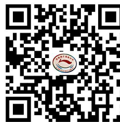
违规禁办事项清单