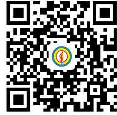
学校服务事项清单